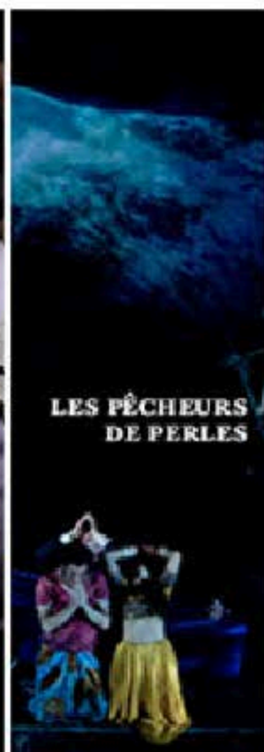
LES PÊCHEURS DE PERLES