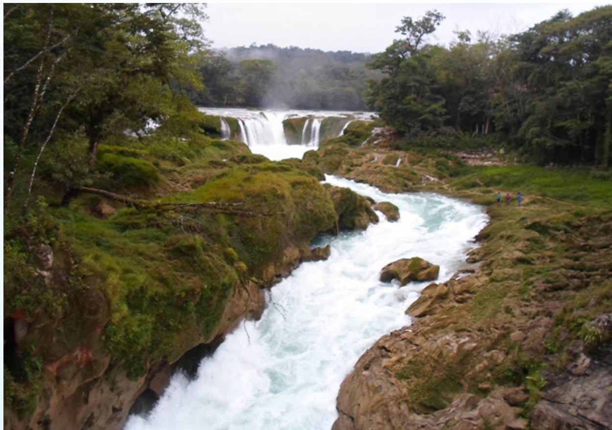
Río Santo Domingo, Chiapas.