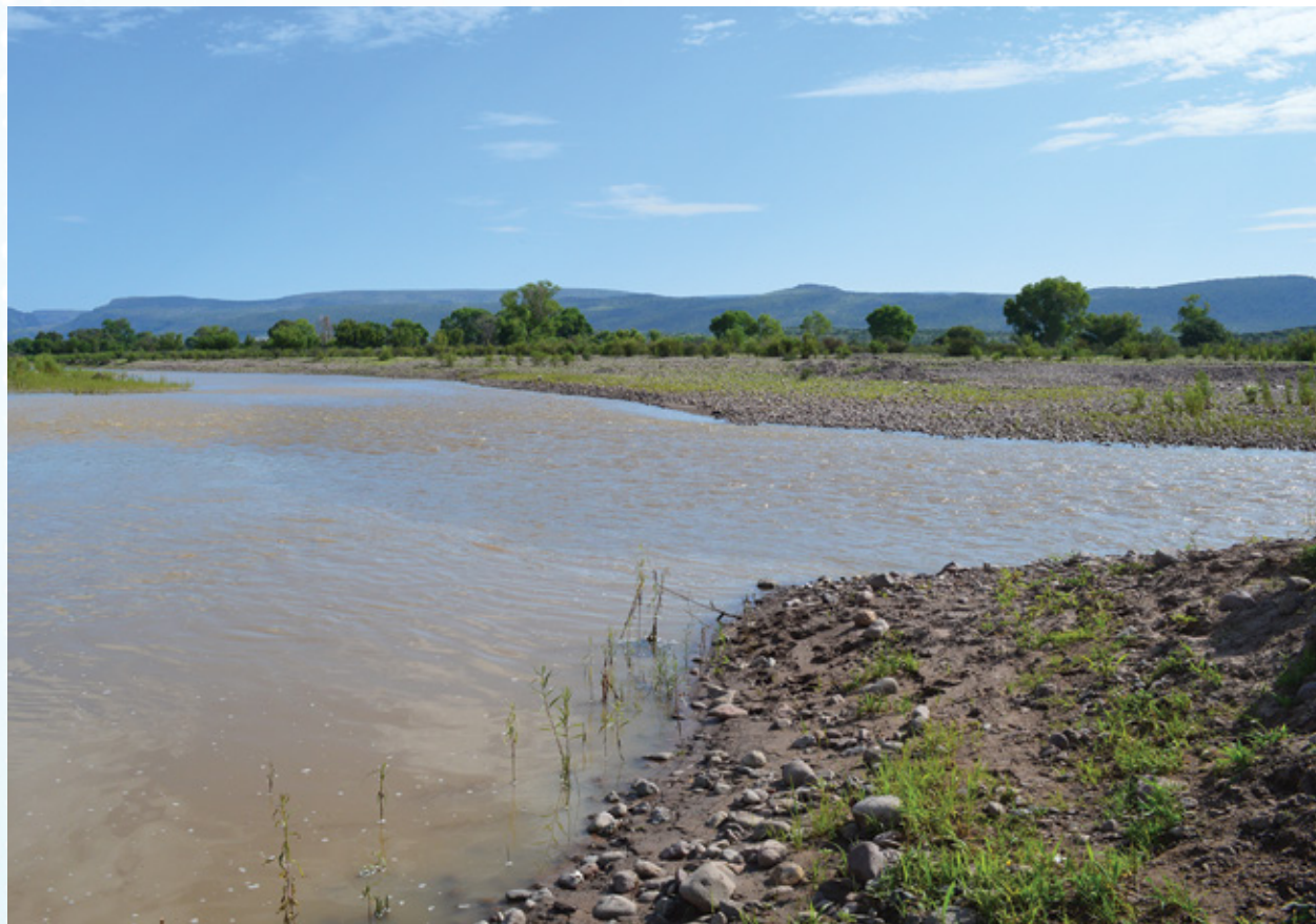
Formación del río Ramos, Durango.