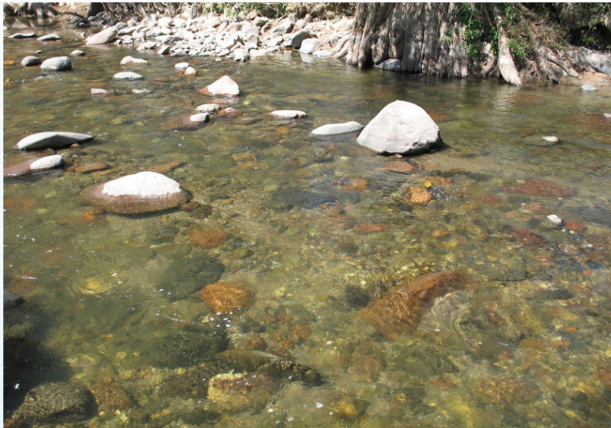
Río Amacuzac, Morelos.