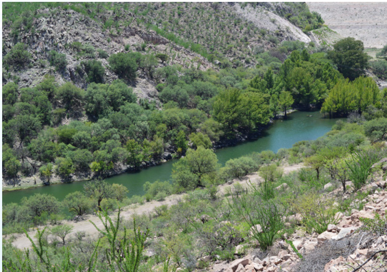
Río Nazas en la salida de la presa Lázaro Cárdenas “El Palmito”, Durango.