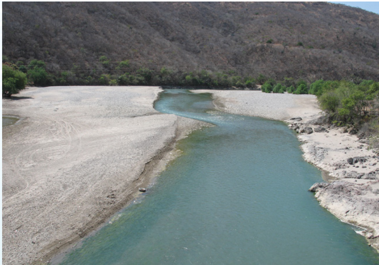
Río Estorax, Querétaro.