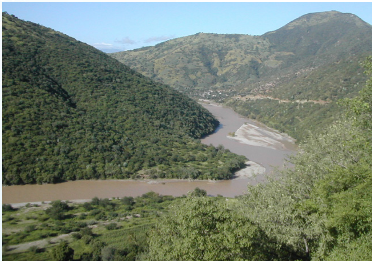
Río Balsas, Morelos.