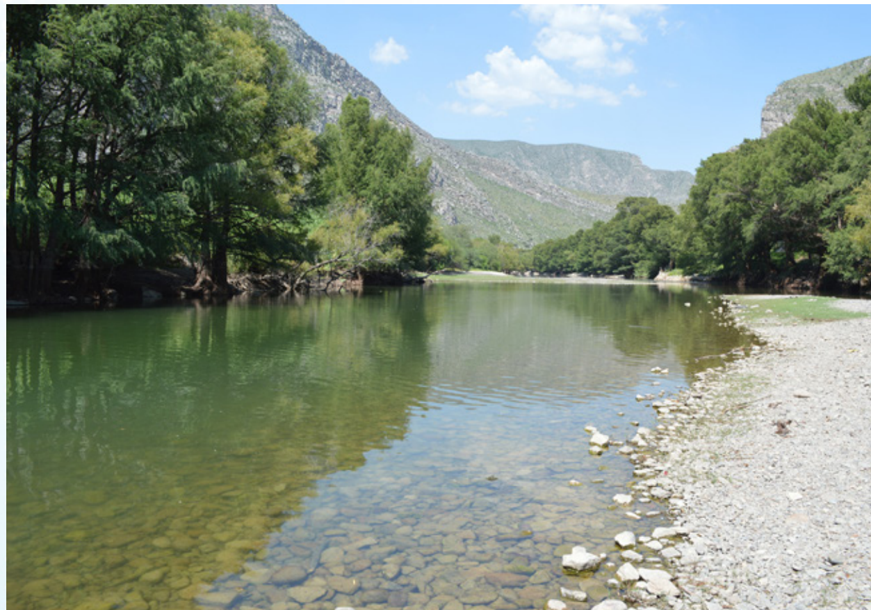
Río Nazas, después de la presa Francisco Zarco “Las Tortolas”, Durango.