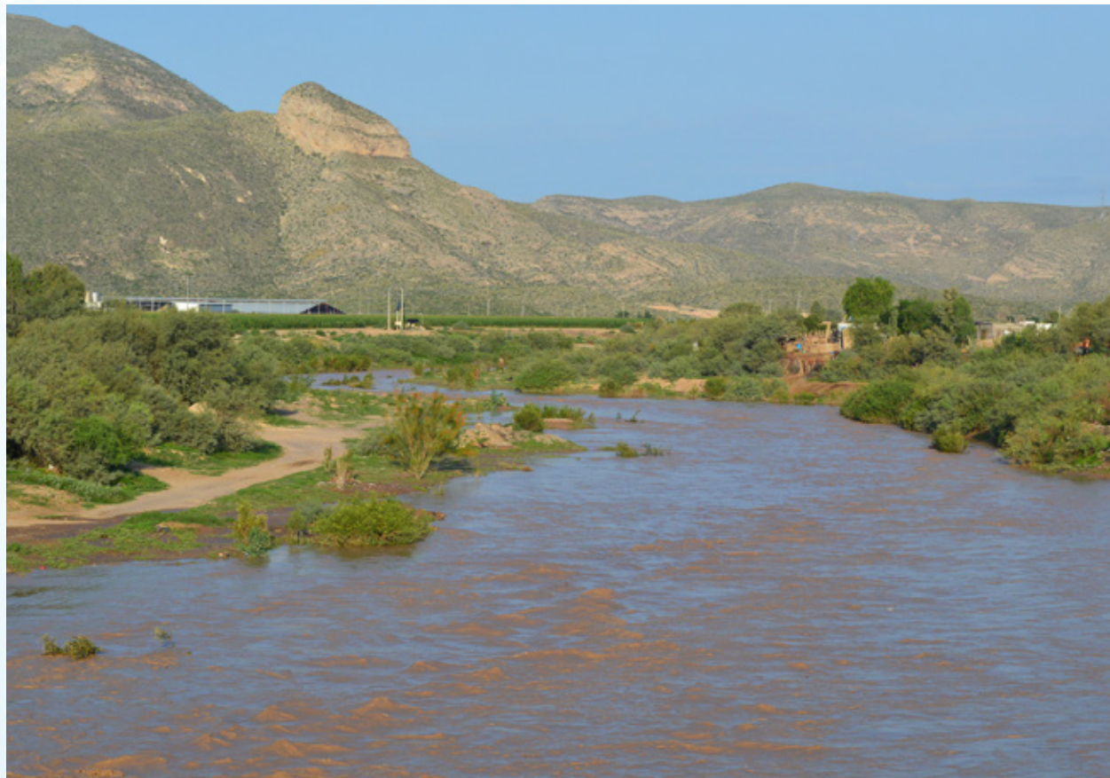
Río Aguanaval, Durango.