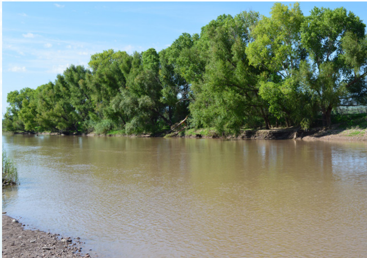
Río Sixtín, Durango.