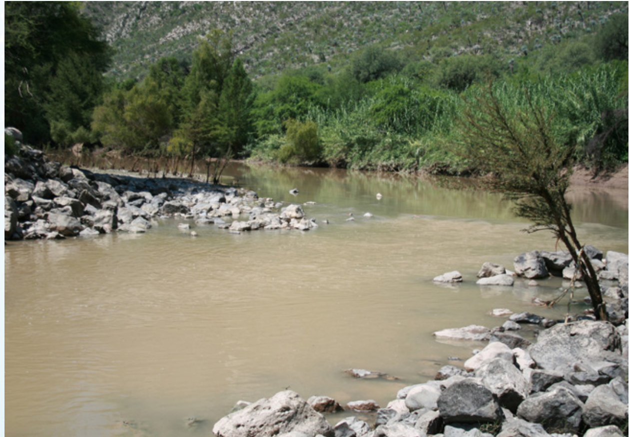
Río Nazas, Durango.