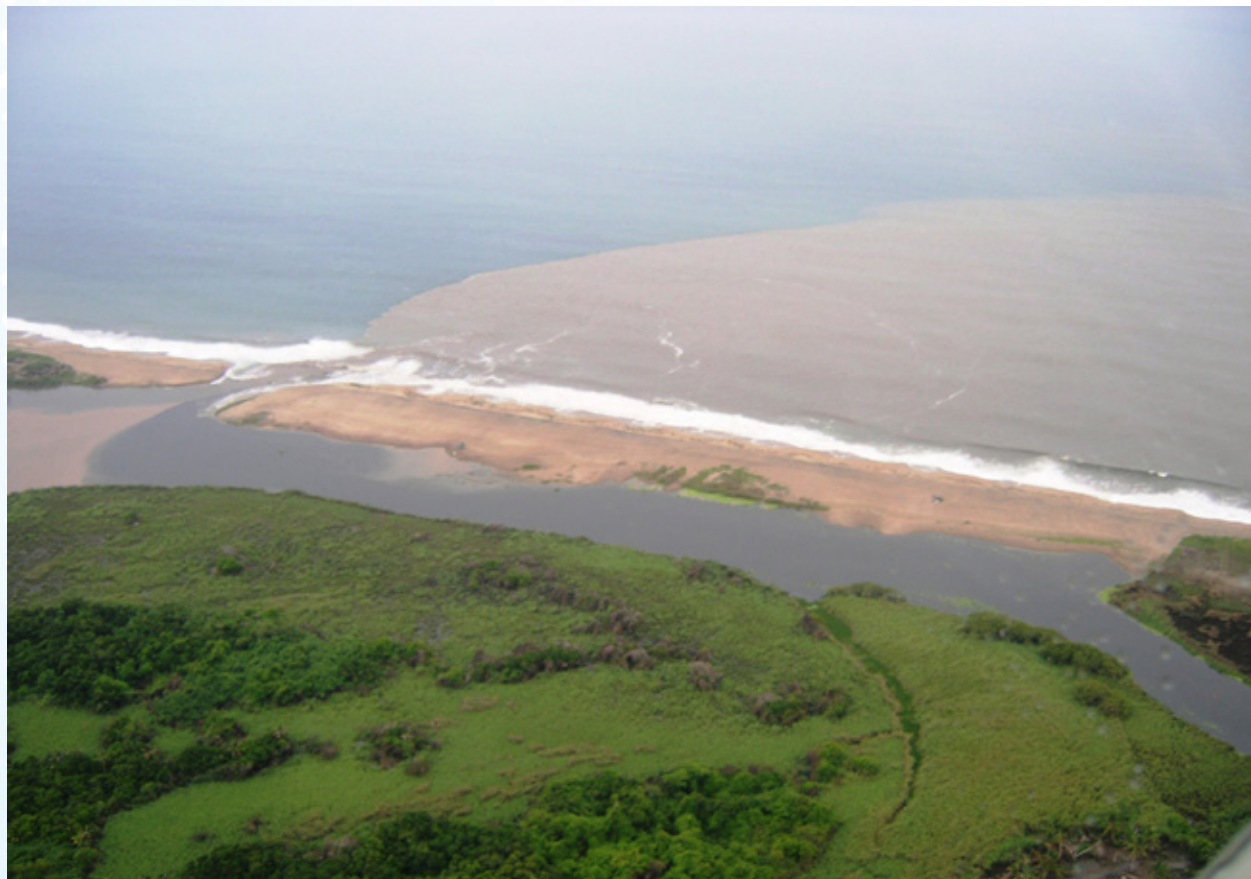
Desembocadura del Río Marabasco, entre el estado de Jalisco y Colima.