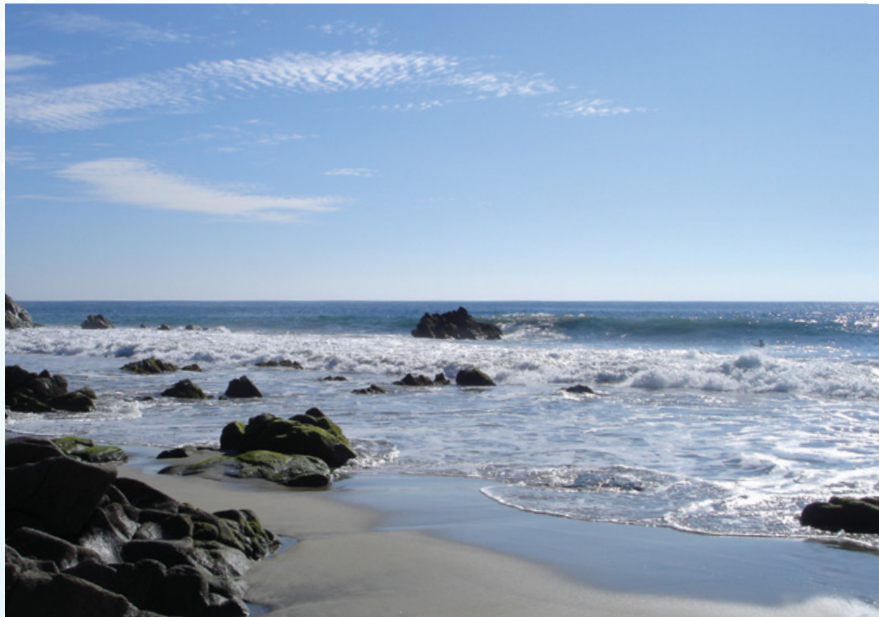
Puerto Escondido, Oaxaca.